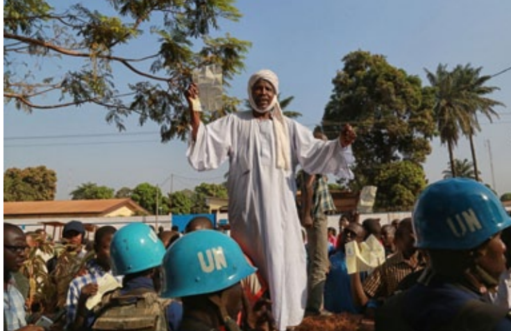
Referendum in der Zentralafrikanischen Republik (2015)

and DGVN@ktuell for free. The DGVN General Secretariat gladly answers your questions on the United Nations.