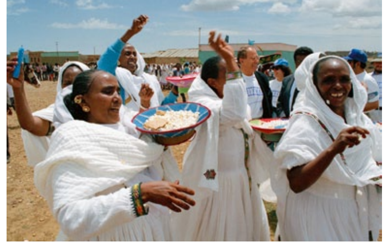
Referendum in Eritrea 1993

Das Entwicklungsprogramm der Vereinten Nationen (UNDP) unterstützt mit einem Budget von 5 Milliarden US-Dollar Programme zur Demokratischen Regierungsführung, Armutsbekämpfung, Krisenprävention sowie Energie und Umweltschutz in über 170 Ländern und koordiniert die Arbeit aller Träger der Entwicklungszusammenarbeit. Das Welternährungsprogramm der Vereinten Nationen (WFP) stellt jährlich mehr als die Hälfte der weltweit geleisteten Nahrungsmittelhilfe bereit.