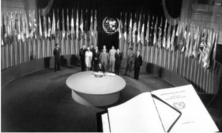
Unterzeichnung der Charta der VN 1945