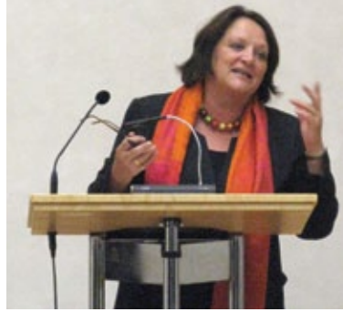
Bundesjustizministerin a. D. Sabine Leutheusser-Schnarrenberger, Vortrag über Stand und Entwicklung des Völkerstrafrechts 2011