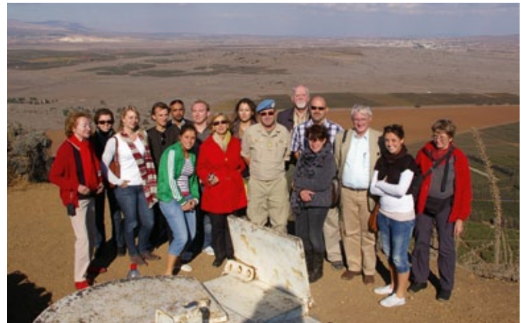
Studienreise Israel-Palästina 2011, hier Besuch der Mission UNDOF am Golan