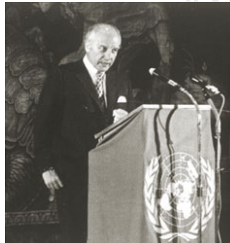
Dr. Walter Scheel 1973 in München