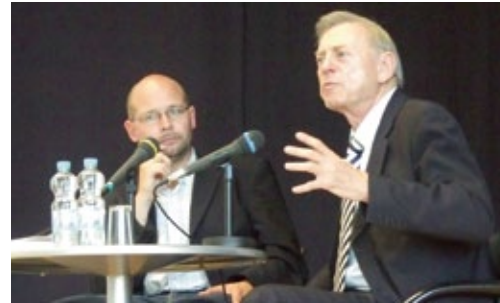
Avi Primor, ehem. Botschafter Israels in der BRD, Vortrag 2011 über Israel und den Nahen Osten