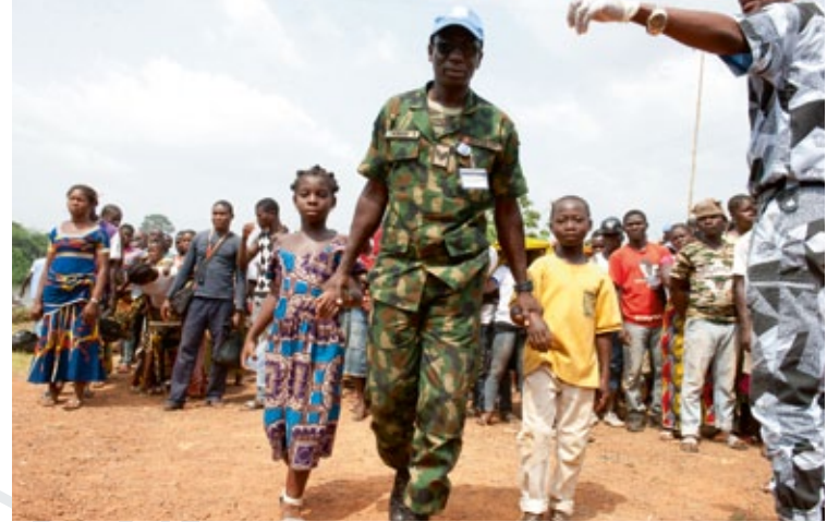
Das Flüchtlingshilfswerk der VN (UNHCR) bringt Flüchtlinge aus der Elfenbeinküste freiwillig zurück in ihre Heimat

The DGVN presents itself on the internet with a wide range of information. You will find information on current events as well as