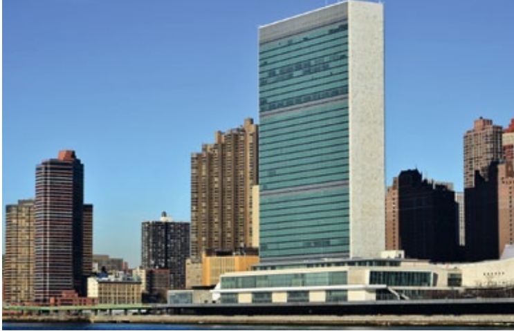
UNO Hauptgebäude New York

Das Generalsekretariat veranstaltet öffentliche Vorträge, Diskussionsforen, Seminare, Symposien und Konferenzen. Der Forschungsrat der DGVN initiiert und betreut wissenschaftliche Arbeiten über die Vereinten Nationen und veranstaltet aktuelle Symposien. Der aus unabhängigen Fachleuten zusammengesetzte Beirat für Weltbevölkerung und Migration unterstützt die Informations-, Bildungs- und Öffentlichkeitsarbeit über bevölkerungsbezogene Fragestellungen.