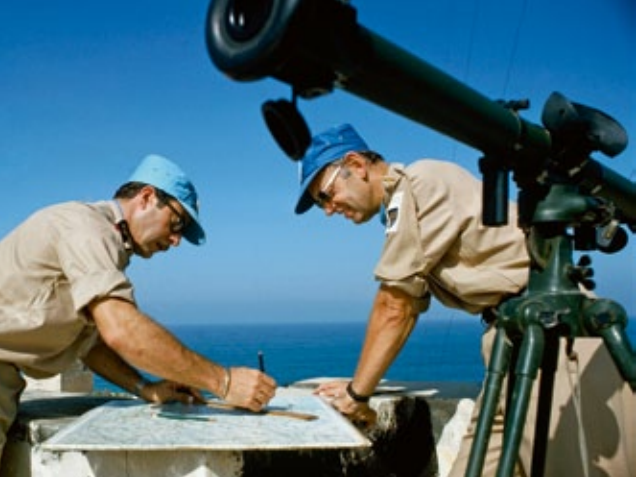
Überwachungsmission (1974) der UN in Palästina (UNTSO)