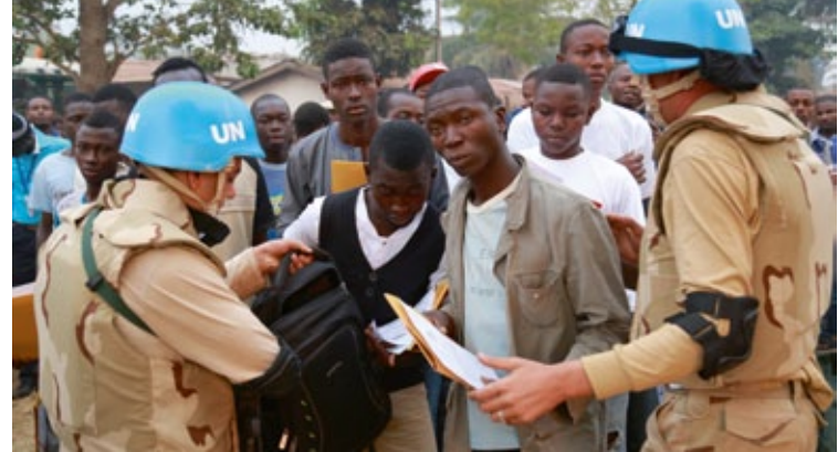
Präsidentenwahlen in der Zentralafrikanischen Republik (2015)

Auf die verstärkte VN-Präsenz weist die Übersiedlung wichtiger internationaler Behörden nach Deutschland hin: 1996 nahm das VN-Freiwilligenprogramm seinen Sitz in Bonn, 2002 wurde der Internationale Seegerichtshof in Hamburg eröffnet. Die 2001 auf dem Petersberg bei Bonn abgehaltene internationale Afghanistan-Konferenz führte zur Bildung einer Übergangsregierung. In der UN City Bonn sind heute 18 Einrichtungen der VN vertreten. Die bedeutendsten sind das Klimasekretariat der VN (UNFCCC), das VN-Freiwilligenprogramm (UNV), das Sekretariat des Übereinkommens der VN zur Bekämpfung der Wüstenbildung (UNCCD) und das Vizerektorat der VN-Universität in Europa (UNU-ViE).